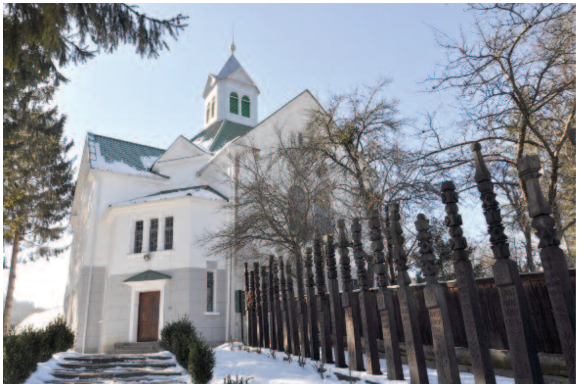
A magyarsárosi unitárius templom