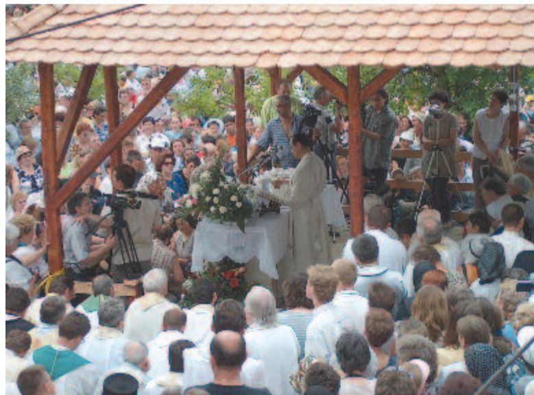
A szőkefalvi Mária-jelenéskor tartott mise