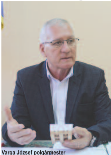
Varga József polgármester

A gyulakutai művelődési otthon külső-belső felújításának pályázata 290 ezer euró, a finanszírozási szerződést aláírták, a közbeszerzési eljárást követően tavasszal kezdődhetnek el a munkálatok. A községközpont járóbeteg-rendelője – ahol négy családorvos és fogorvos rendel – ugyancsak felújításra szorult, erre 330 ezer eurót sikerült lehívni. Bár az 1-es és 2-es számú iskola felújítási pályázata nem volt nyertes, a napközi otthon és az óvoda felújítására 330 ezer eurót, a 3-as számú általános iskola teljes körű felújítására 132 ezer eurót sikerült lehívni. A Tormás utcában 900 métert szándékoznak leaszfaltozni, ez része a Havadtót Ravával összekötő út aszfaltozási pályázatának. Saját költségvetésből ravatalozót építenének, annak költsége meghaladja a 100 ezer eurót. Pályázatot indítottak a községközpont uniós arculatának kialakításáért, ami a sáncok kibetonozását, egységes hidak és kerékpársáv kiépítését foglalja magában. Terveik között szerepel egy korszerű, téli-nyári sportkomplexum létesítése, amely uszodát, teniszpályát, futballpályát, kosárlabdapályát stb. foglalna magában. A Küküllőmenti Kistérségi Társulás Leader-programja keretében 65 ezer eurós pályázatot nyertek nyolc-kilenc munkagép – többek között hókotró, fűnyíró, homlokrakodó – beszerzésére a község karbantartási munkálataihoz.