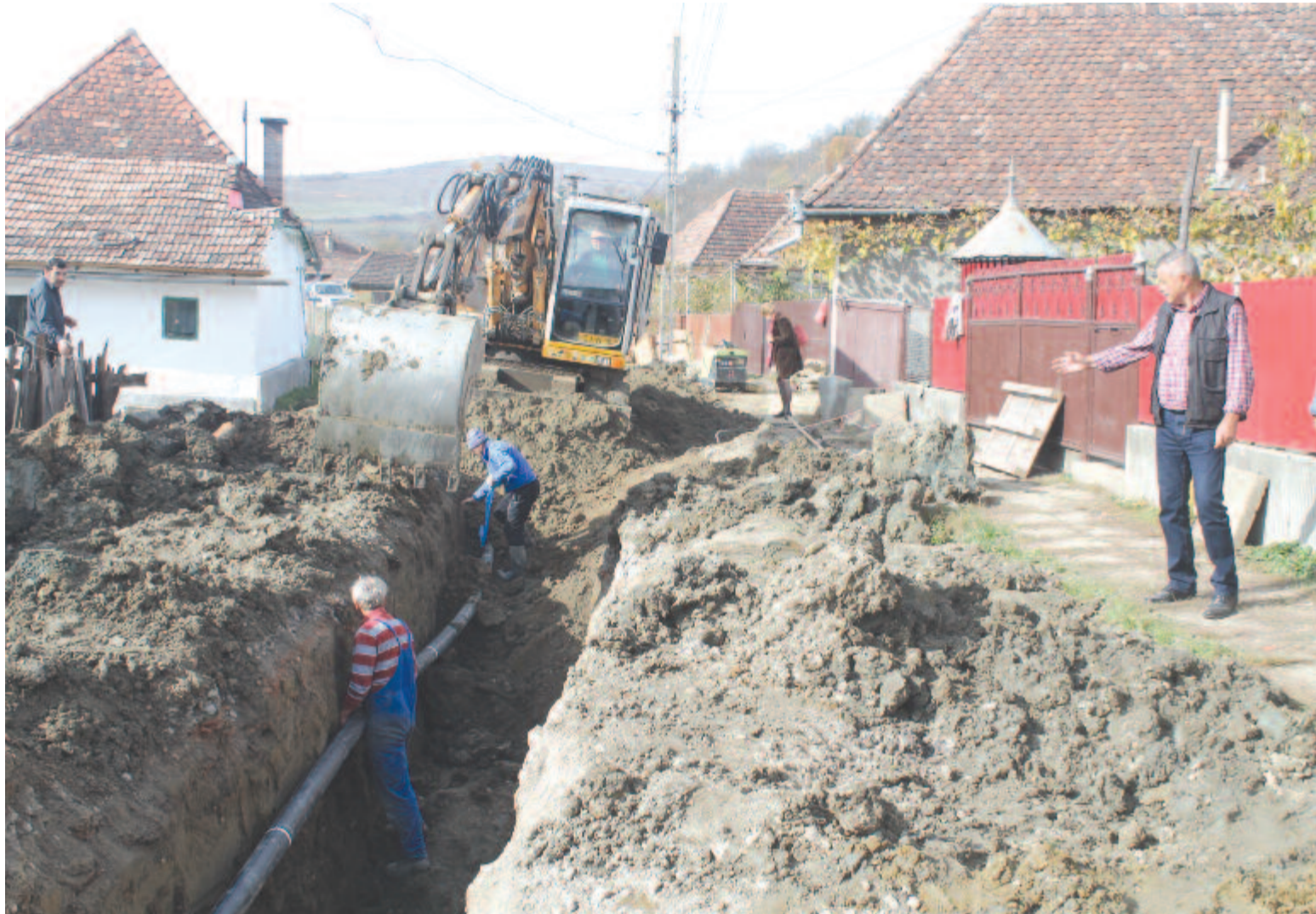
Készül a csatornahálózat Havadtón